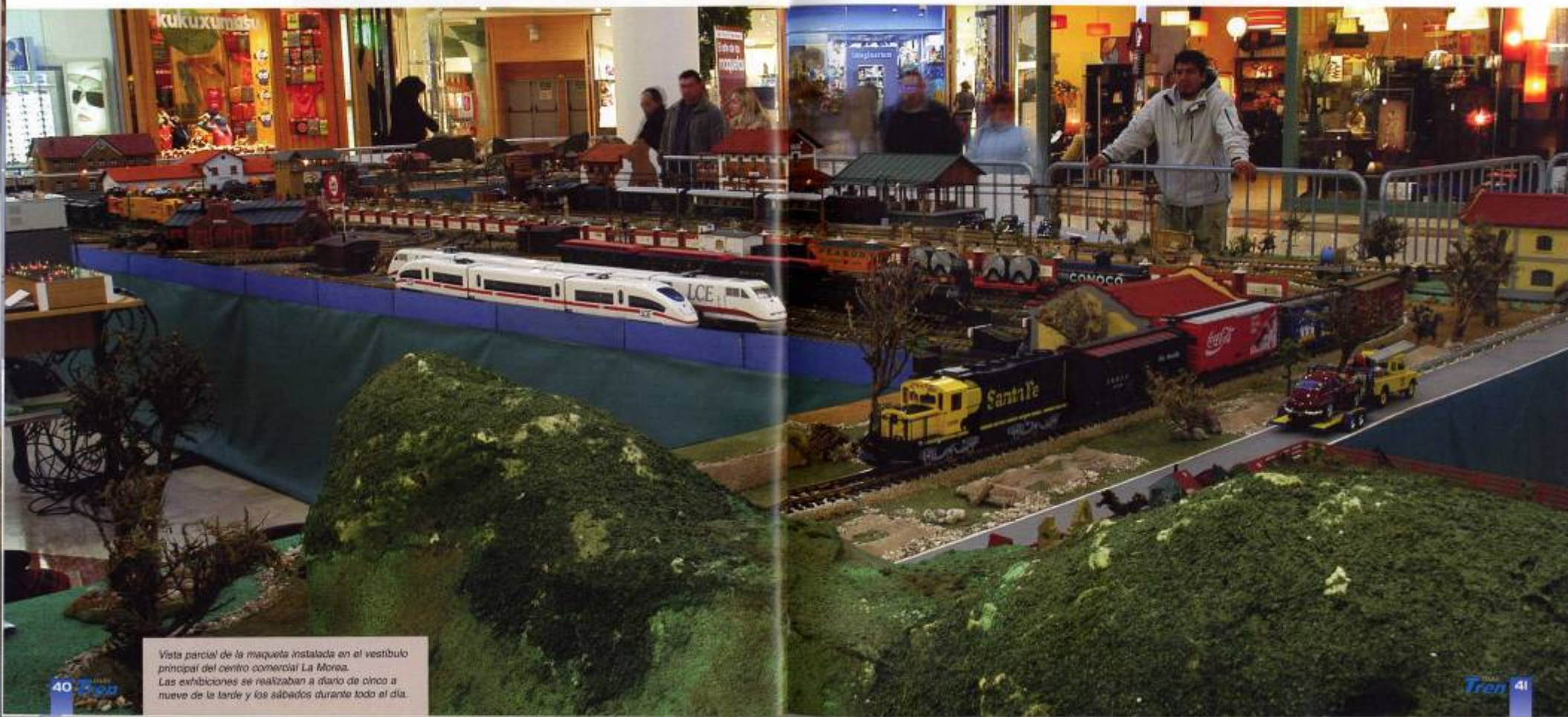
Vista parcial de la maqueta instalada en el vestíbulo principal del centro comercial La Morea. Las exhibiciones se realizaban a diario de cinco a nueve de la tarde y los sábados durante todo el día.