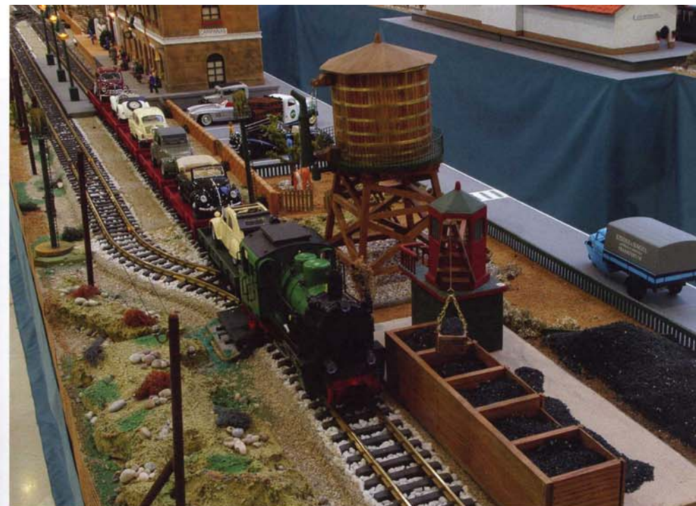
A la salida de la estación, se encuentra la zona para el repostaje de las locomotoras: la aguada, con su depósito y la reserva de carbón. En el extremo opuesto, están las instalaciones del aserradero: el propio edificio con la sierra y el cobertizo para almacenar la madera.