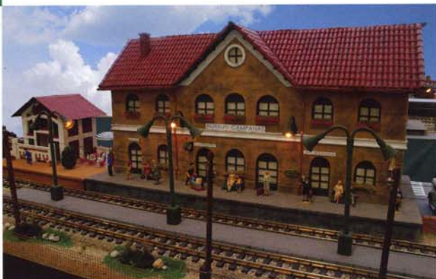
Biurun Campanas es una estación navarra situada a unos 20 km de Pamplona, su reproducción a escala 1:22,5 es espectacular: consta del edificio principal y la "pequeña" caseta de los retretes; en el andén, no faltan los detalles del reloj y la campana.

Como se observa en las fotografías, los edificios llaman poderosamente la atención. Nuestro maquetista se va-