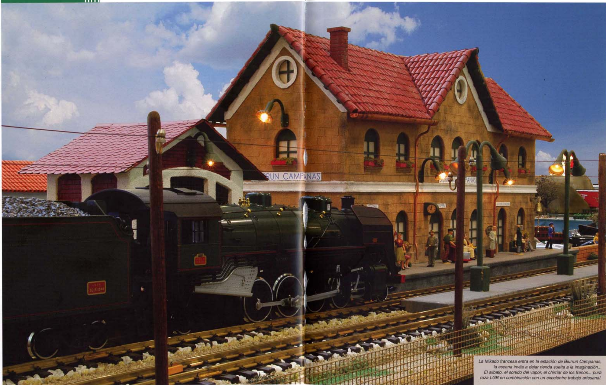
La Mikado francesa entra en la estación de Biurrun Campanas, la escena invita a dejar rienda suelta a la imaginación... El silbato, el sonido del vapor, el chirriar de los frenos... pura raza LGB en combinación con un excelente trabajo artesanal.