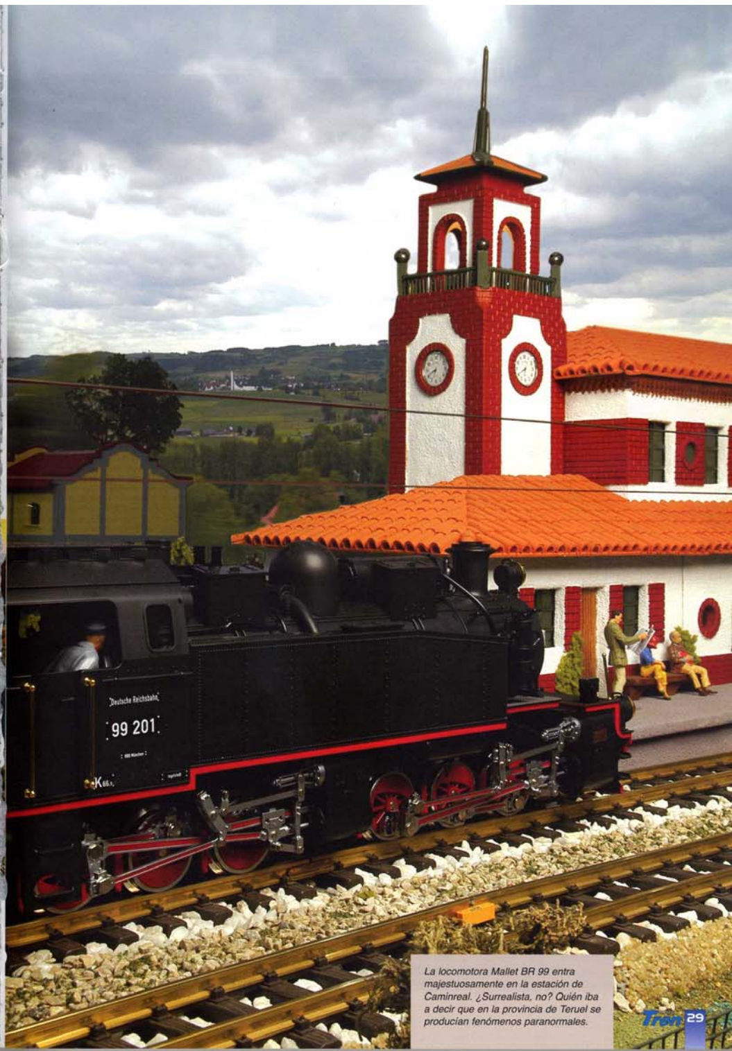
La locomotora Mallet BR 99 entra majestuosamente en la estación de Caminreal. ¿Surrealista, no? Quién iba a decir que en la provincia de Teruel se producían fenómenos paranormales.